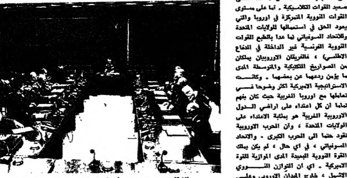
الاطلسيون يجتمعون في قتل الهاجس السوفياتي!

هذه التطورات التي بدت لسنوات قليلة خلت انها الطريق الى السلام الاوروبي الدائم (الذي يقوم عليه الى حد بعيد السلام الدولي) لم تجد من ينكرها في